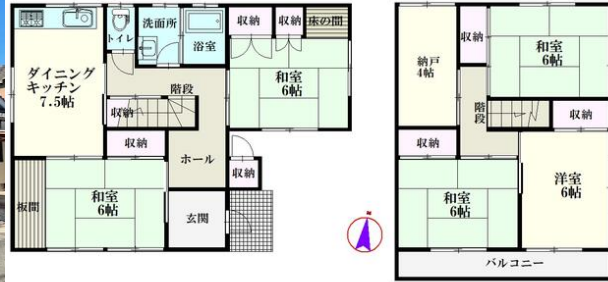
1階 2階 ※間取図は略図となりますので、実際と異なる場合がございます。