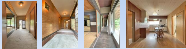
玄関 玄関 廊下 ダイニング