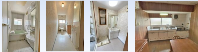
風呂 トイレ 洗面 キッチン