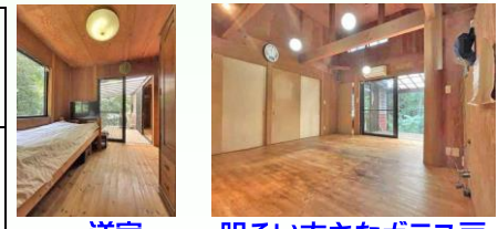
洋室 明るい大きなガラス戸

生活便 約3KM内…診療所、支援センター 約3.5KM内…小学校、郵便局 約4.5KM内…コンビニ、JA 約14KM内…市役所、ヤマダ電機 約14.5KM内…救急病院