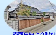
南西方向より眺む