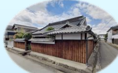
東南方向より眺む