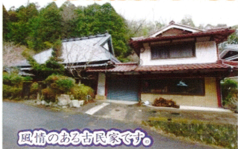
風情のある古民家です。