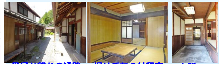
母屋と離れの通路 掘りごたつ付和室 玄関