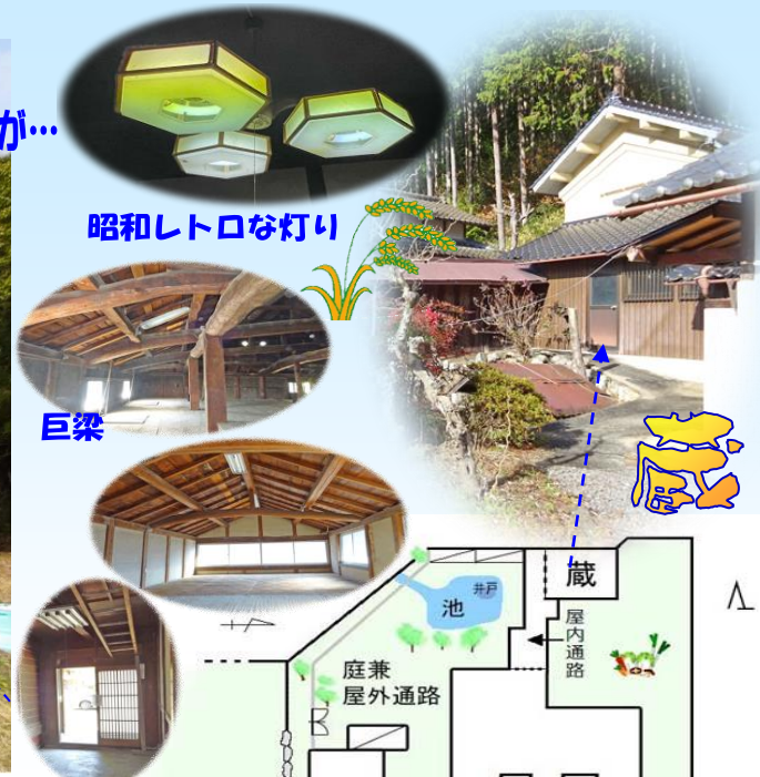
昭和レトロな灯り