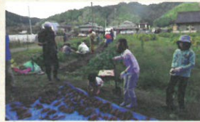
しゅうかく サツマイモの収穫