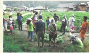
しゅうかく スイカの収穫