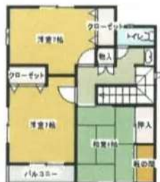
篠山黒岡分譲住宅新築工事 3号地

建築概要 敷地面積 151㎡ 建築面積 60.48㎡ 延べ床面積 108.40㎡ 建築確認番号 第篠B 89号 工事 未着工 建築施工 大道工務店