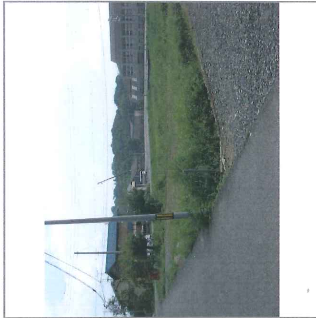
岡野小学校が見えます