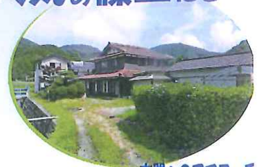
玄関へのアプローチ