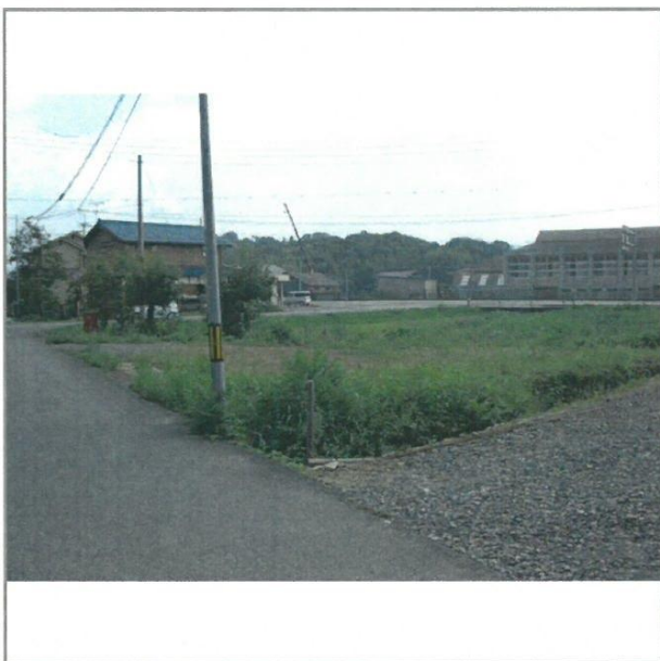
岡野小学校が見えます